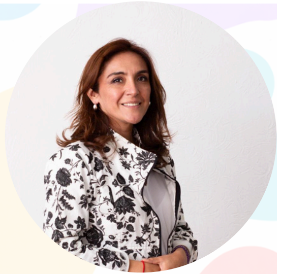
ZANDRA MAULÉN JOFRÉ ALCALDESA I. MUNICIPALIDAD DE EL MONTE

Cuenten con una municipalidad que actúa, que escucha y que rinde cuentas. Y cuenten conmigo, con la convicción de que juntos podemos transformar este momento en una oportunidad para cuidarnos más y querernos mejor. Porque El Monte no se rinde, se une, se apoya y sigue adelante, con el corazón en cada barrio y la esperanza en cada familia.